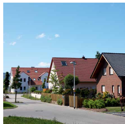
Beim Nahwärme-Contracting teilen sich mehrere Haushalte eine Wärme-erzeugungsanlage.

Eine spezielle Form des Contractings ist das sogenannte Nahwärme-Contracting. Die Konzepte von Nah- und Fernwärme lassen sich zwar nicht trennscharf voneinander unterscheiden, wichtig ist dabei jedoch die Länge der Übertragungsleitung für die Wärmelieferung. So bedeutet Nahwärme eine Übertragung von Heizwärme zwischen benachbarten oder nahe beieinanderstehenden Gebäuden. In der Praxis teilen sich beim Nahwärme-Contracting mehrere Haushalte eine gemeinsame Wärme-erzeugungsanlage, die durch uns betrieben, betreut und gewartet wird. Also ein Contracting mit mehreren Wärmeabnehmern, die nicht alle im selben Gebäude leben. Da anders als bei der Fernwärme die Einheiten der versorgten Haushalte kleiner sind, lassen sich dafür sehr gut auch innovative kleine Kraft-Wärme-Kopplungs-Anlagen sowie erneuerbare Energien einsetzen. So eignen sich beispielsweise Mini-Blockheizkraftwerke oder solarthermische Anlagen je nach Wärmebedarf hervorragend für ein Nahwärme-Contracting-Modell. Bei allen Contracting-Lösungen zahlen wir als Betreiber sämtliche Investitionen, Reparaturen sowie Wartungsarbeiten und übernehmen die sachkundige Planung, Installation und die Betreuung der neuen Anlage.