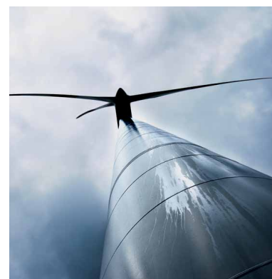
Hart am Wind: On- und Offshore machen Windkraftanlagen die natürliche Energie nutzbar.

Offshore-Windparks sind hingegen außer Sichtweite auf dem offenen Meer platziert. Hier ist das Windaufkommen deutlich höher als an Land, sodass sich mit größeren Anlagen sehr hohe Erträge erzielen lassen. Einer der ersten kommerziell genutzten Offshore-Windparks ist „Baltic 1“. Er erzielt in der Ostsee mit 21 Windrädern eine Leistung von fast 50 Megawatt.