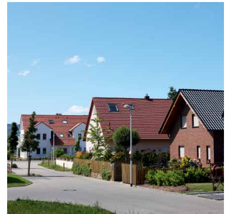
Beim Nahwärme-Contracting teilen sich mehrere Haushalte eine Wärmeerzeugungsanlage.

Eine spezielle Form des Contractings ist das sogenannte Nahwärme-Contracting. Die Konzepte von Nah- und Fernwärme lassen sich zwar nicht trennscharf voneinander unterscheiden, wichtig ist dabei jedoch die Länge der Übertragungsleitung für die Wärmelieferung. So bedeutet Nahwärme eine Übertragung von Heizwärme zwischen benachbarten oder nahe beieinanderstehenden Gebäuden. In der Praxis teilen sich beim Nahwärme-Contracting mehrere Haushalte eine gemeinsame Wärmeerzeugungsanlage, die durch uns betrieben, betreut und gewartet wird. Also ein Contracting mit mehreren Wärmeabnehmern, die nicht alle im selben Gebäude leben. Da anders als bei der Fernwärme die Einheiten der versorgten Haushalte kleiner sind, lassen sich dafür sehr gut auch innovative kleine Kraft-Wärme-Kopplungs-Anlagen sowie erneuerbare Energien einsetzen. So eignen sich beispielsweise Mini-Blockheizkraftwerke oder solarthermische Anlagen je nach Wärmebedarf hervorragend für ein Nahwärme-Contracting-Modell. Bei allen Contracting-Lösungen zahlen wir als Betreiber sämtliche Investitionen, Reparaturen sowie Wartungsarbeiten und übernehmen die sachkundige Planung, Installation und die Betreuung der neuen Anlage.