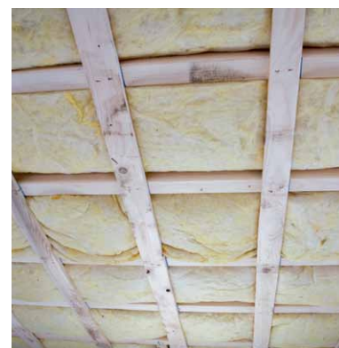
Die Zwischenräume einer Decke lassen sich am besten mit mineralischen Dämmstoffen ausfüllen.

Das Angebot an Dämmstoffen ist sehr vielfältig. Es reicht von aufgeschäumten Kunststoffen über aufgeschäumtes Glas bis hin zu anorganischen Stoffen wie Mineralwolle.